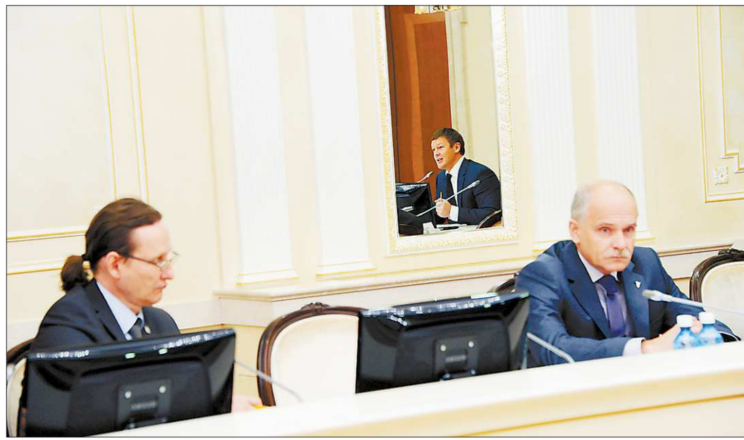
Продвижение заявки Екатеринбурга на проведение «ЭКСПО-2020» будет зависеть от успешности Иннопрома-2013