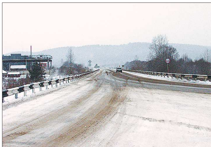
Отремонтированное по новой технологии дорожное покрытие может служить в полтора-два раза дольше

Секрет долговечности этого дорожного покрытия