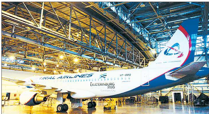
Очередной аэробус готов агитировать за Екатеринбург...

С основным докладом о преимуществах России как потенциальной стран-хозяйке ЭКСПО-2020 и Екатеринбурга как города-кандидата на право проведения выставки выступил Аркадий Дворкович. Он отметил, что крупный промышленный центр и транспортный узел, город с мощным научно-исследовательским потенциалом, Екатеринбург находится на пересечении путей между Европой и Азией, что даёт ему право претендовать на проведение Всемирной выставки.