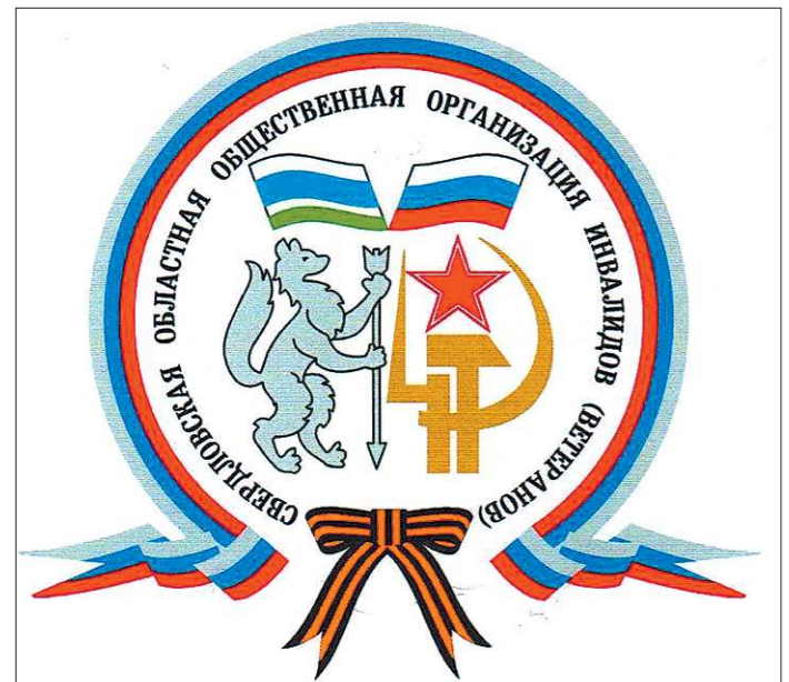
Эмблема областного совета ветеранов

Адрес областного совета: 620014, Екатеринбург, ул. 8 Марта, д. 16а, тел./факс (343) 376-67-88, 376-67-89, e-mail: veteranov.sovet@yandex.ru, сайт: www.sovoveteran.ru.