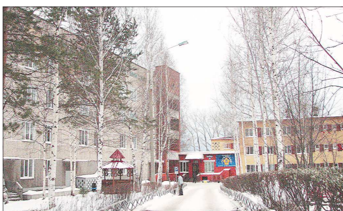
В любое время года у пансионата «Тагильский» уютный и опрятный вид