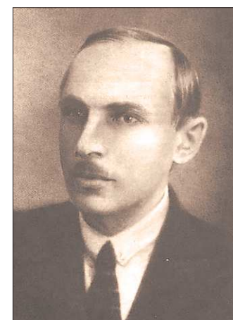
Николай Соколов - последний следователь сгинувшей империи

В 1924 году во Франции, в саду близ дома в местечке Сальбри, было найдено тело русского эмигранта Николая Алексеевича Соколова. Он несколько лет расследовал убийство царской семьи в Екатеринбурге и обладал уникальным архивом об этом событии. Эта тайна, по мнению многих, и свела его в могилу.