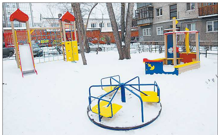
От подачи заявки до появления площадки на Первомайской, 108 прошло чуть больше полугода. Установили новое оборудование за неделю