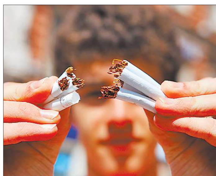
По данным Роспотребнадзора, в возрасте 15-19 лет курят сорок процентов юношей и семь процентов девушек России. В абсолютных цифрах - это более трёх миллионов подростков