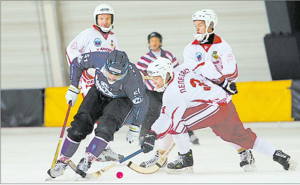
ПРЕСС-СПУЖЕВ ХК - УРАЛЬСКИЙ ТРУБНИК

Сегодня в Архангельске, Москве, Иркутске и Кирове стартует чемпионат России по хоккею с мячом. Причём в Кирове он стартует трижды. Рано утром здесь сыграют первоуральский «Уральский трубник» и ульяновская «Волга», днём – казанское «Динамо» и нижегородский «Старт», а вечером дойдёт черёд и до хозяев – местная «Родина» проведёт матч против красногорского «Зоркого».