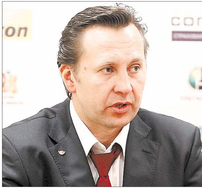
Болельщики поверили новому тренеру. Поможет ли он игрокам «Автомобилиста» поверить в себя?