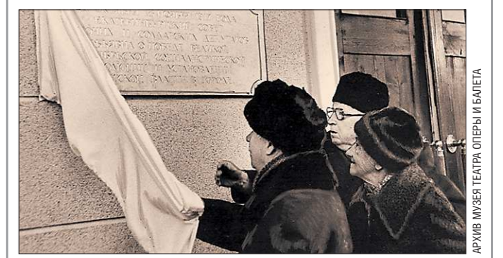
По свидетельству работников театра, эта мемориальная доска «долго валялась где-то у сантехников, а потом пропала – возможно, кто-то забрал на дачу».

КСТАТИ. После реконструкции здания театра (в 1982 году) в память об этом событии была установлена мемориальная доска, которая была снята в начале 90-х годов.