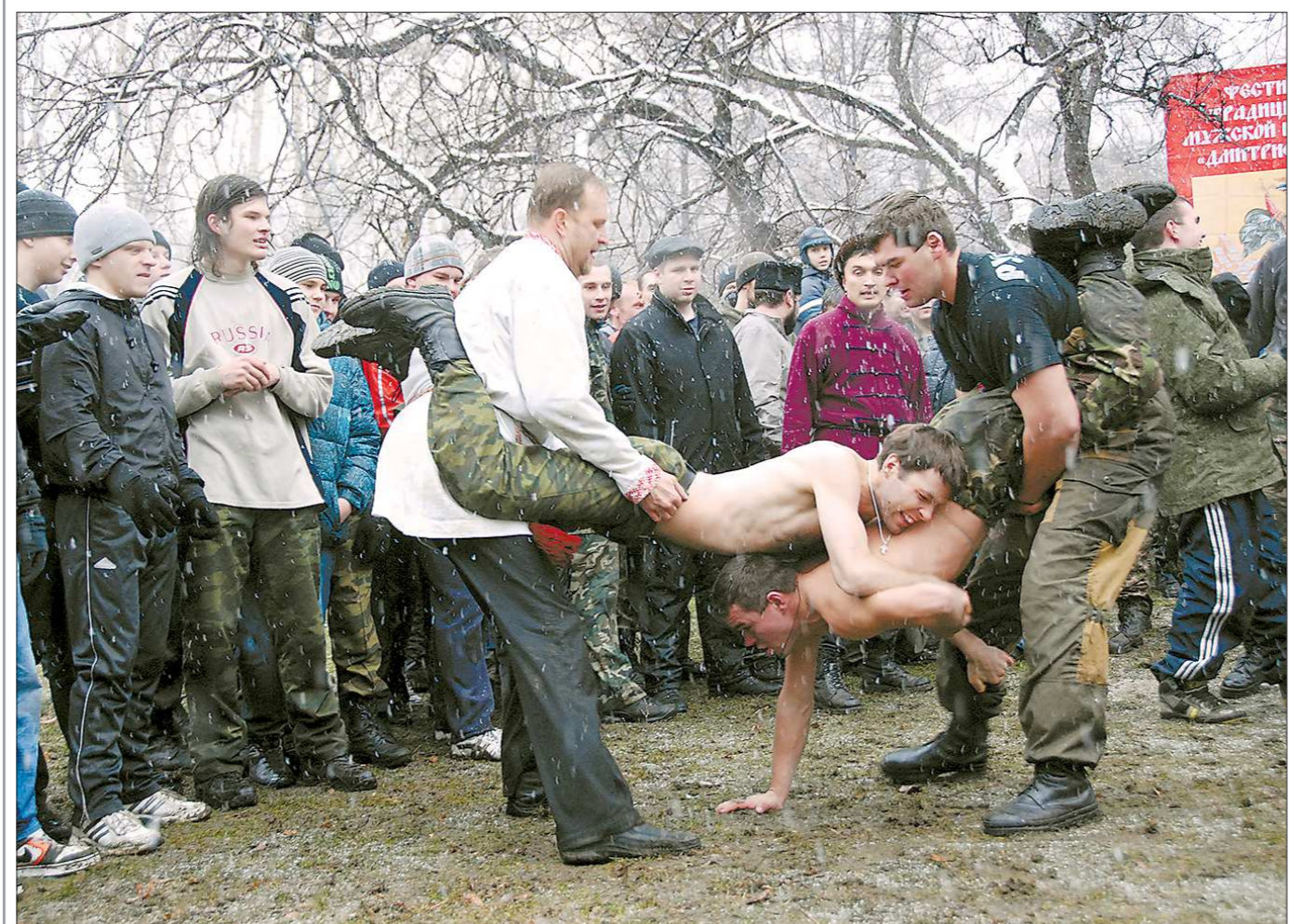
В минувшие выходные в Екатеринбурге отпраздновали Дмитриев день. На фестиваль русской мужской культуры собралось несколько сотен человек из разных уголков Свердловской области. Большую часть гостей составили члены патристических клубов, существующих под эгидой Фонда святого великомученика Дмитрия Солунского. В течение трёх часов добры молодцы разных возрастов соревновались в силе и ловкости: сходились стенка на стенку, бились на ремнях и кулаках