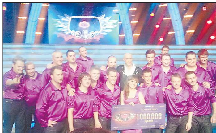
Главный приз в проекте «Битва хоров» — миллион рублей, но для участников хора «Виктория» куда важнее было отстоять честь родного Урала

Как показали итоги минувшего сельскохозяйственного сезона, никакая другая территория Свердловской области не может нынче похвастать таким богатым запасом кормов, какой заготовили шалинские хозяйства — в среднем у них вышло по 24,1 центнера кормовых единиц на условную голову скота. Вот когда к штату пришлось шалинские дожди.