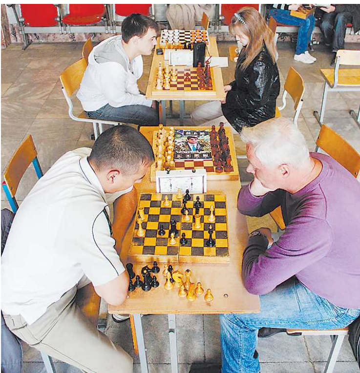
Три раза в неделю шахматисты встречаются лицом к лицу.