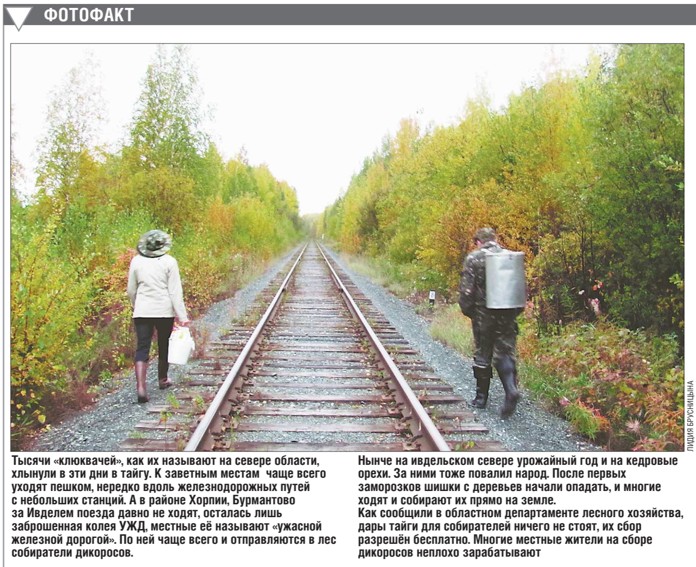
ФОТОФАКТ Тысячи «клюквачей», как их называют на севере области, хлынули в эти дни в тайгу. К заветным местам чаще всего уходят пешком, нередко вдоль железнодорожных путей с небольших станций. А в районе Хорпи, Бурмантово за Ивделем поезда давно не ходят, осталась лишь заброшенная колея УЖД, местные её называют «ужасной железной дорогой». По ней чаще всего и отправляются в лес собиратели дикоросов.

Кстати, в самих РЖД заявляют, что возможное возвращение зимнего времени и необходимость в связи с этим менять расписание поездов не принесёт значительных финансовых убытков и может доставить неудобства только пассажирам.