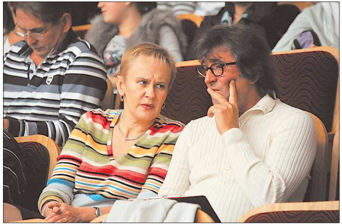
Юрий Башмет пообещал замолвить слово об открытии интерната для юных музыкантов

Отборочные туры проходили в разных городах страны, последней будет Москва — 6 октября, а уже в конце ноября в Сочи пройдут «предстартовые» репетиции и мастер-классы и состоится первое выступление нового симфонического коллектива в Сочи. За дирижёрским пултом будет стоять maestro Башмет.