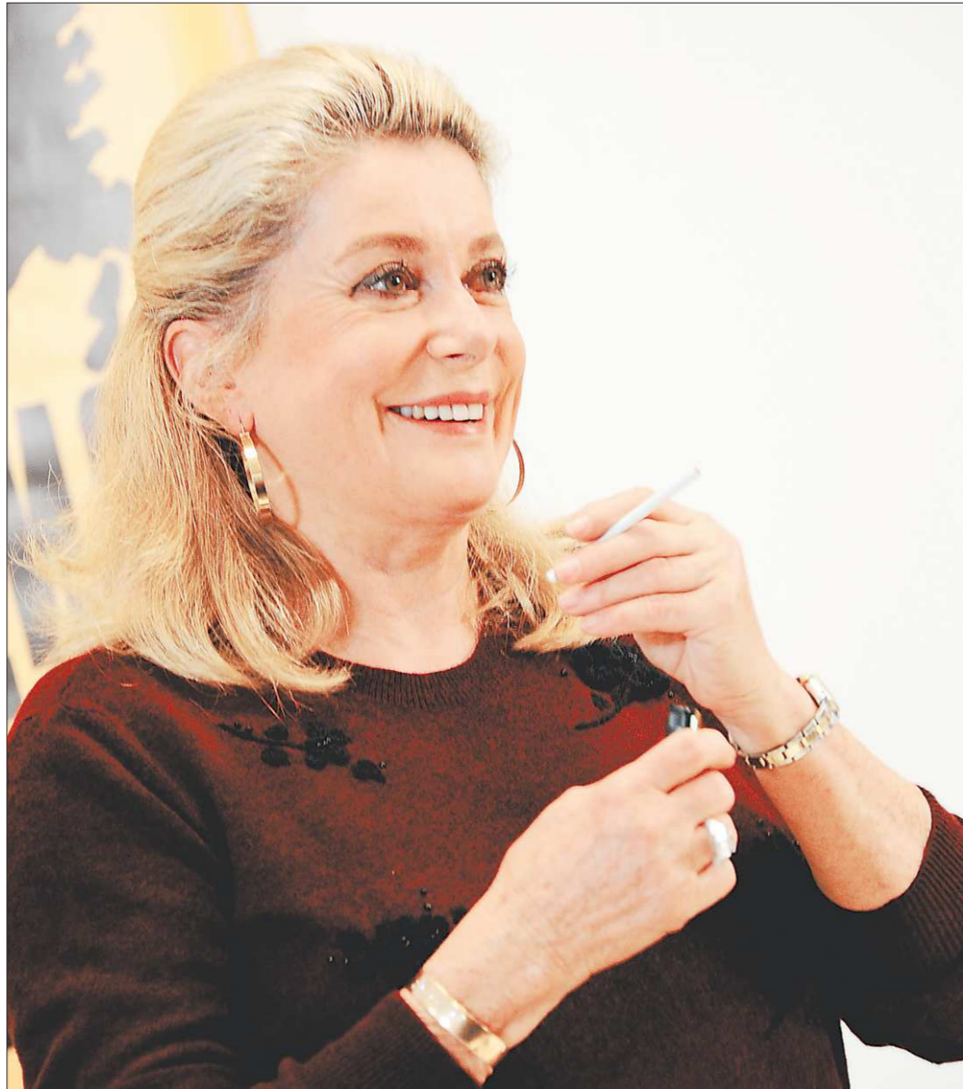
Катрин Денёв очень заинтересовалась тем, что на Урале есть своя, Свердловская киностудия. Шанс для сотрудничества!

А мы с друзьями сопровождали в Ленинграде на гастролях певца Максима Ле Форестье. Было весело. Молодость!