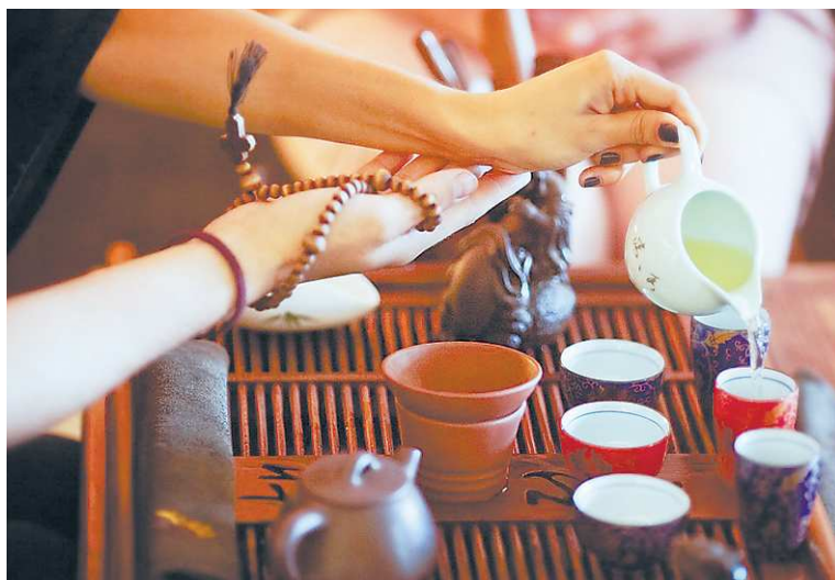
Точность и плавность движений мастера – залог успешной чайной церемонии.

Чайные традиции в Китае насчитывают не одно столетие. За это время было выработано множество способов приготовления чая для разных случаев. Появились не только чаепития на каждый день, но и изысканные, больше похожие на ритуал, способы приготовления и распития этого напитка. Поскольку сам процесс рождал в человеке особые, торжественные чувства, на Западе его стали называть «цере-