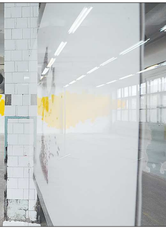
КСТАТИ. Биеннале – это выставка, которая проводится раз в два года

Открытие второй биеннале, на мой взгляд, проигрывает первой. Пока я вижу, что проект идёт на понижение. Одна из причин – не используются в полную меру силы местных художников. Хотя уральские мастера во многом превосходят зарубежных, приглашённых на биеннале. Задача современного искусства – расширять коммуникации, уральская же биеннале завязана на узкой группе людей. Организаторам следует помнить один из важнейших законов теории систем: «Закрытая система всегда рухнет». Цель индустриальной биеннале – создать положительный имидж Свердловской области. Сегодня эта задача не выполняется.