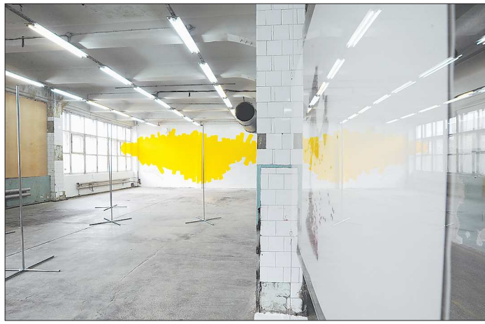
Изображение жёлтого пятна на стене «выставочного зала» издали и вблизи