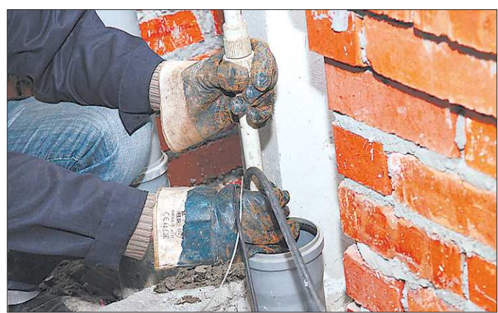
Аварийная бригада снова направила щупальца «Спрута» в трубу «нехорошей» квартиры

Долг превысил 50 тысяч рублей и исчерпал терпение коммунальщиков. Отключение электроэнергии в квартире результатов не дало, и тогда установили «Спрут». Когда отсутствие элементарных удобств стало невыносимым, хозяйка протолкнула заглушку из квартирного канализационного отвода в общий стояк.