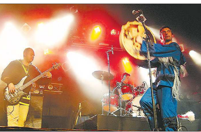
Группа «H-Ural» – первый ансамбль, соединивший музыку народов тайги, рок и современную электронику

По словам создателя фестиваля, бездейственность молодых рок-групп и соответственно их быстрое угасание связаны не с их леностью и нежеланием искать способы продвижения, а с отсутствием или недоступностью самих возможностей для продвижения. В частности, недостаточность репетиционных баз по приемлемым ценам. Нижняя планка аренды помещения начина-