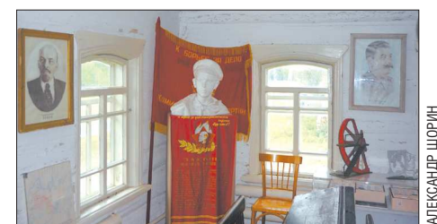
Бюст в две натуральные величины между портретами Ленина и Сталина до сих пор окружает гостиную музея