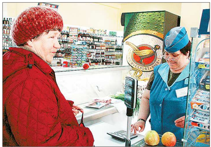
Приятно сделать покупку со скидкой