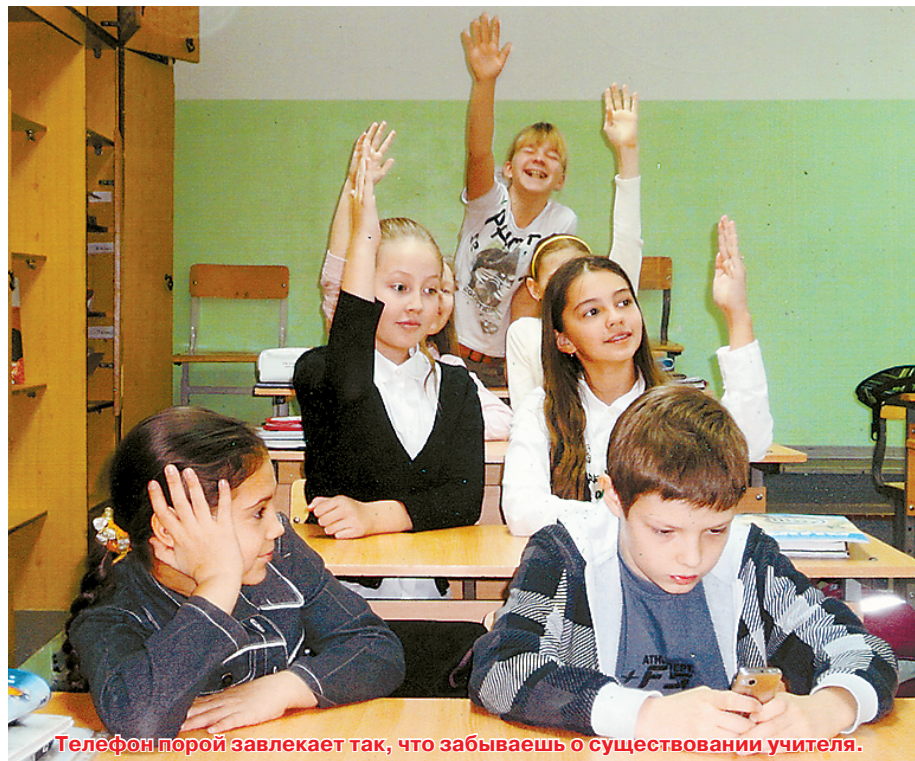
Телефон порой завлекает так, что забываешь о существовании учителя.

Одно дело списать контрольную работу. Даже если ученик поленится хорошо замаскировать телефон и будет раскрыт учителем, то самое тяжкое наказание для него – это «двойка» в журнал и неприятный осадок на душе.