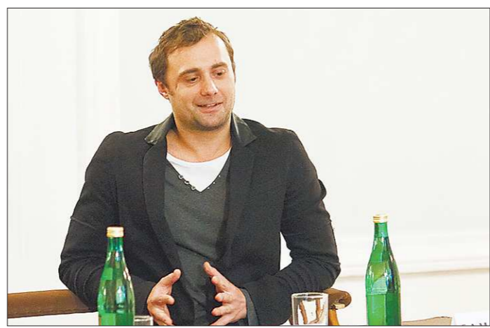
Бывший Ромео, принц Зигфрид и граф Альберт сегодня — новатор в «области балета»