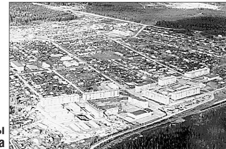
Пелым с высоты птичьего полёта