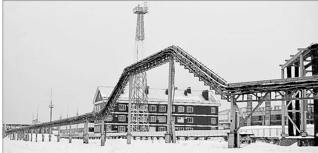
Производственные площадки Пельмского ЛПУ не только функциональны, но и красивы

А что «жертва науки»? Бунтует? Жалуется? Совсем нет. Общение с прекрасным полом – достойная плата за