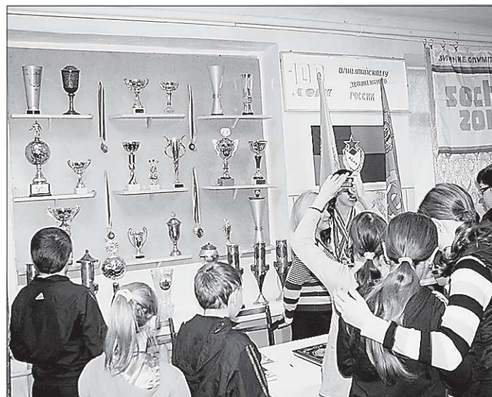
Спортивные достижения, трофеи последних лет также нашли своё место в музее