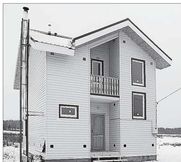
Сейчас этот дом — самый новый в округе