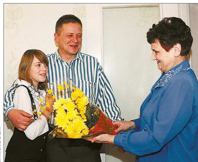
У семьи Коротких — новоселье!

В этот светлый праздник желаю Вам и Вашим близким всех благ от Господа нашего Иисуса Христа! Божией милостью, смиренный КИРИЛЛ, Митрополит Екатеринбургский и Верхотурский Рождество Христово 2011 / 2012 год