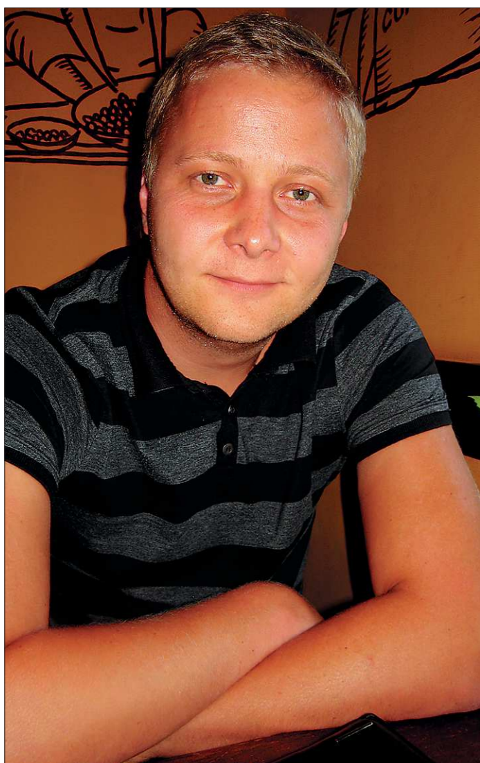
Главное всё-таки музыка

Настоящий музыкант остаётся музыкантом, независимо от места работы