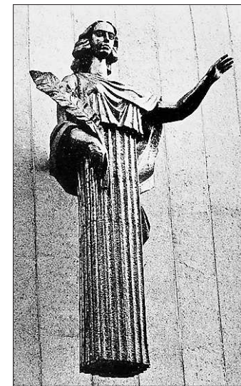
Муза кино благословляет всех входящих в Екатеринбургский Дом кино

бинного понимания не было. Я только когда поступал в Строгановское, увидел настоящую скульптуру. Раньше — как учебное пособие. У нас на одного студента приходилось 60 преподавателей! Учили комплексно: надо было образованным во всех отраслях и сферах. Диплом — пять портретов, один в бронзе. Плохие работы обычно переплавляли, моя до последнего времени оставалась нетронутой.