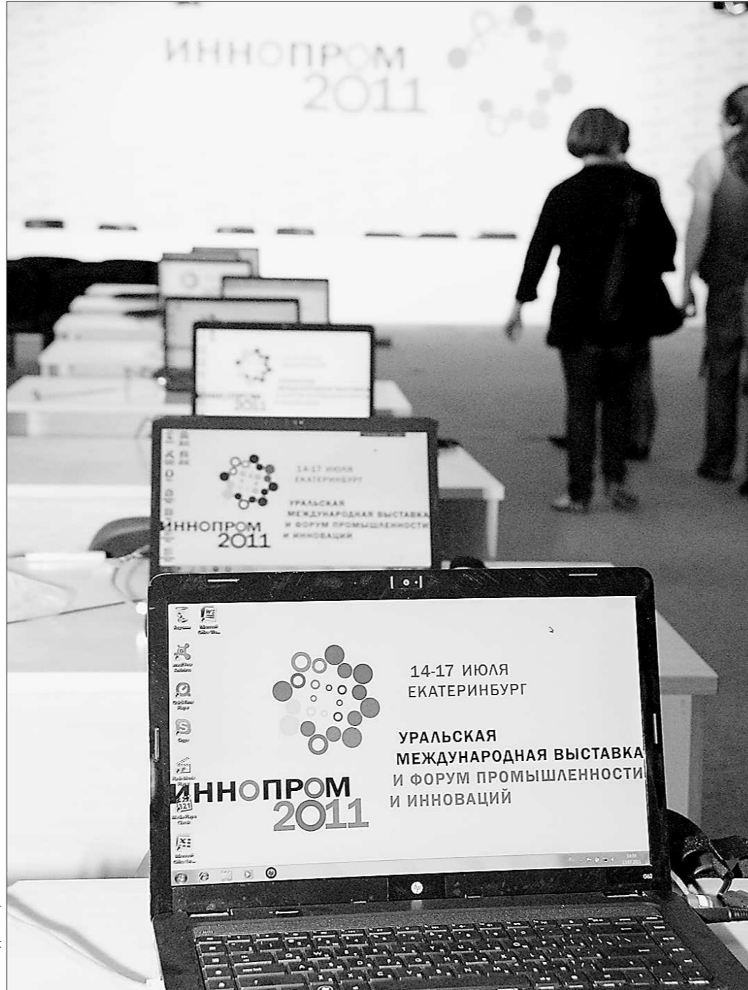
Работу «Иннопрома» будут освещать полтысячи журналистов, следите за новостями...

Посетить «Иннопром» также смогут все желающие. 17 июля — День открытых дверей. В этот день на выставке ожидают около 6 тысяч посетителей. В первую очередь в этот день «Иннопром» ориентирован на детскую и молодежную аудиторию. Планируется, что в течение Детского дня «Иннопром-2011» организованно посетят более тысячи детей, отдыхающих в летних оздоровительных лагерях Сысерти, Ревды, Берёзовского, Первоуральска, и сопровождающих их педагогов, а также ученики уральских школ из 32 муниципальных образований, активно занимающиеся техническим творчеством.