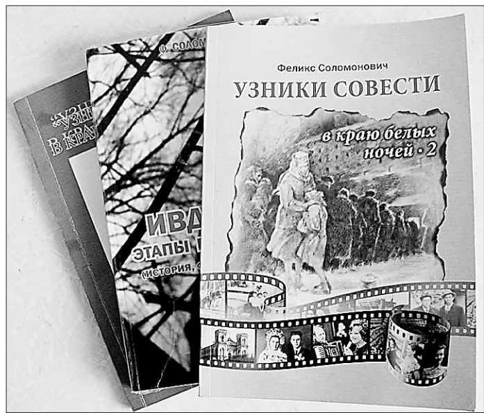
Усилиями энтузиастов создаётся драматическая летопись ГУЛАГа

С. Ившин искренне надеется, что местная власть обратит внимание на его предложения развития родного края и включит их в программу «Народного фронта», которая формируется в настоящее время. Он уверен: решать проблемы Верхотурья можно, только объединив общими целями духовную и светскую власть и жителей округа.