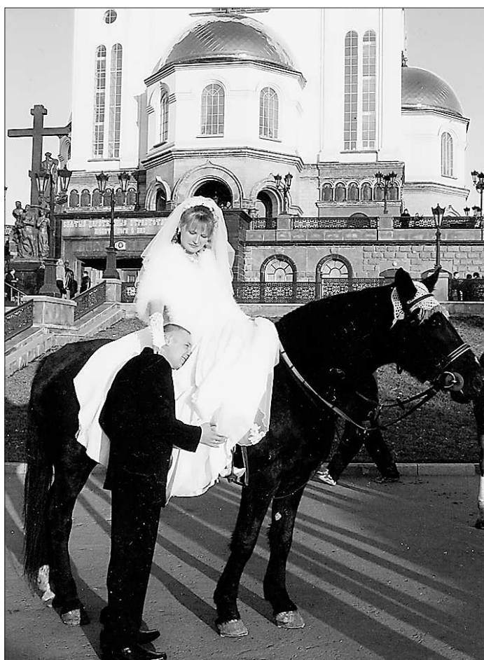
Сегодняшние молодожёны и коня на скаку остановят, и недельное дежурство у загса вынесут