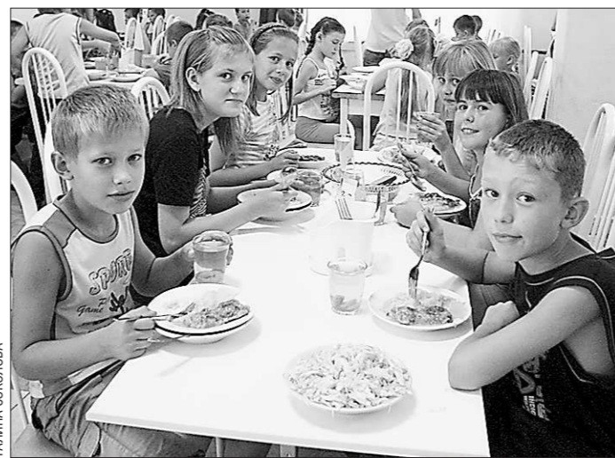
Аппетит на свежем воздухе просто зверский

Всего на отдых в здравнице на станции Анатольская было подано более тысячи заявлений, но за три оставшихся смены лагерь сможет принять только 660 детей. Отдых со спор-