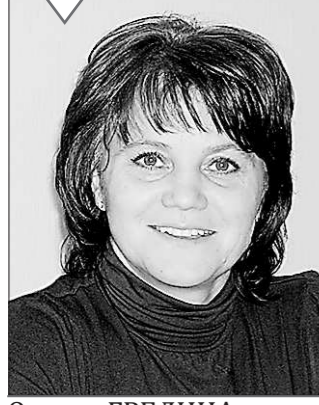
Оксана ГРЕДИНА, ректор Института развития образования Свердловской области