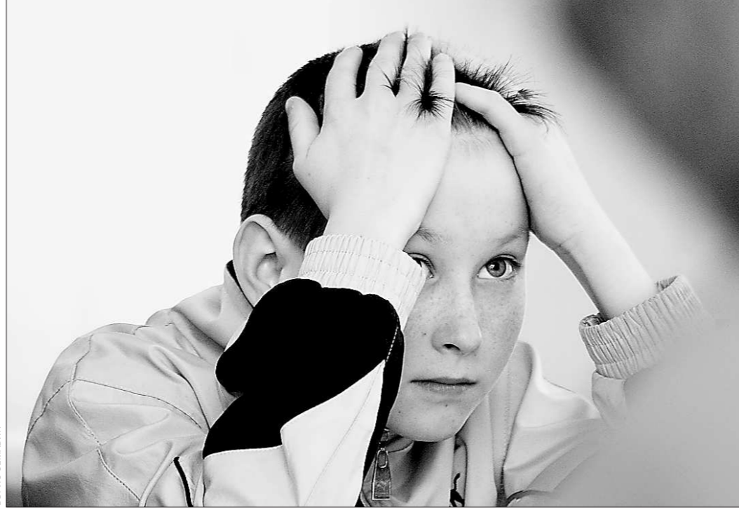
Подростки понимают, что обладают правом на уникальность, и активно отстаивают его

— Как я поняла, звонят не только дети, но и родители. С какими вопросами они обращаются? — Когда начинается взросление и кажется, что подростки «отбиваются от рук», родители не готовы отпустить взрослого ребёнка, не готовы дать ему больше самостоятельности. Начинаются суровые меры воздействия, а ребёнок восстает, его вынуждают совершать отчаянные поступки. Если нет понимания, что надо уважать подростка, он тем же ответит. Но вообще, если звонит родитель — значит, в чём-то сомневается,