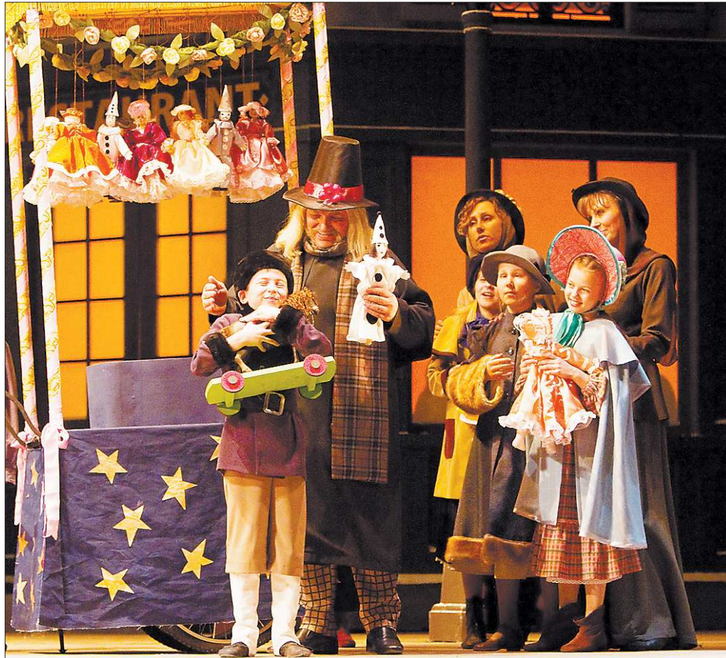
«Богема». Париж, Латинский квартал, сочельник... В этой сцене дети становятся главными персонажами оперы

Такое, на притчу, случилось как раз на «Детском дивертисменте» — концерте по случаю 20-летнего юбилея хора. В номере «Снег» на музыку М. Славкина в нужный момент... снег пошёл! Но заметили это только юные артисты (да разве что родители, знающие, по рассказам ребят, подробности каждого номера). Мальчишки и девочки так правдоподобно изображали приземляющиеся на ладони снежинки, так артистично сдували эти невидимые снежные хлопья, что... когда «снег» всё же пошёл с верхних колосни-