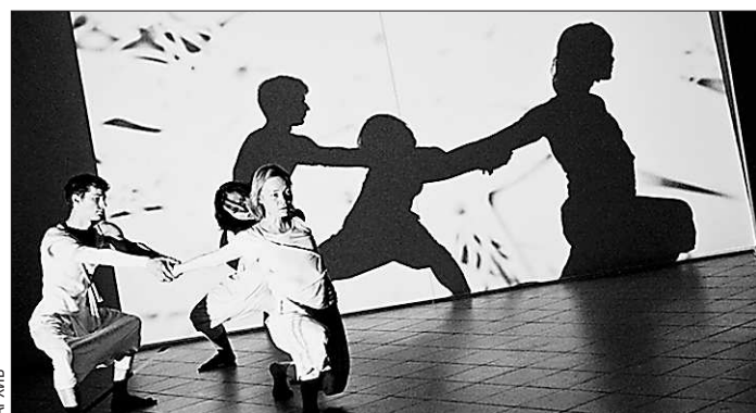
Украшением церемонии открытия первого «PixelVision» стало выступление «специального танцевального коллектива» на тему видеоролика «Parks on fire»

Третий и четвёртый матчи полуфинальной серии до трёх побед «Синара» проведёт в Тюмени 23-24 мая.