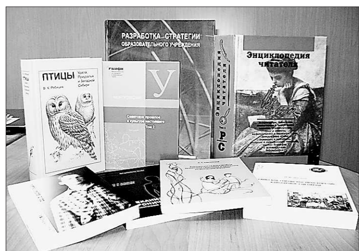
За 25 лет издательство подготовило более трёх тысяч изданий