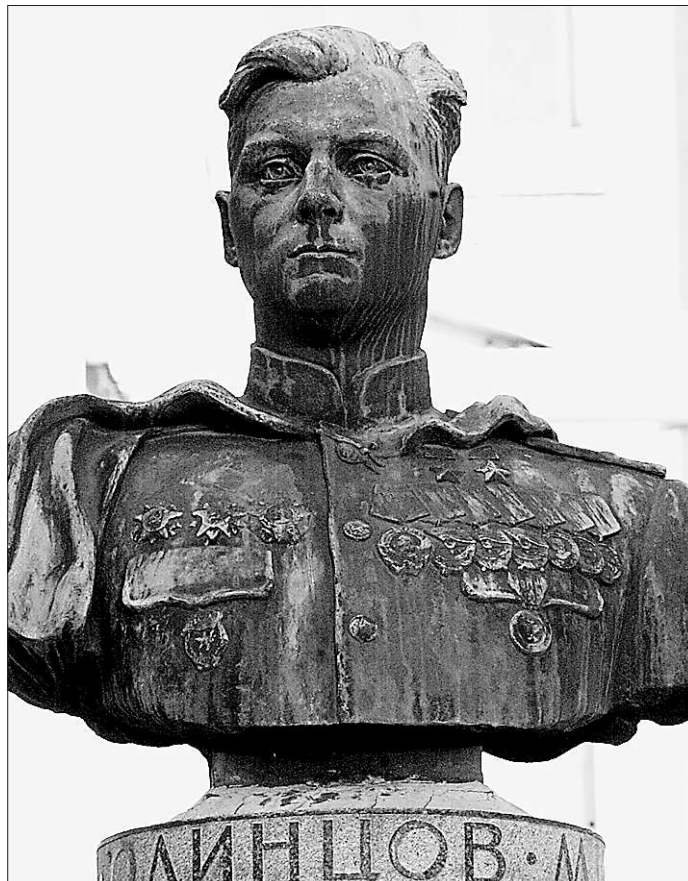
Бюст дважды Героя Советского Союза в Екатеринбурге — память на все времена

6 мая на перроне Екатеринбургского вокзала прощальное земляка встречали руководители Свердловского областного и Екатеринбургского городского советов ветеранов генерал-майор в