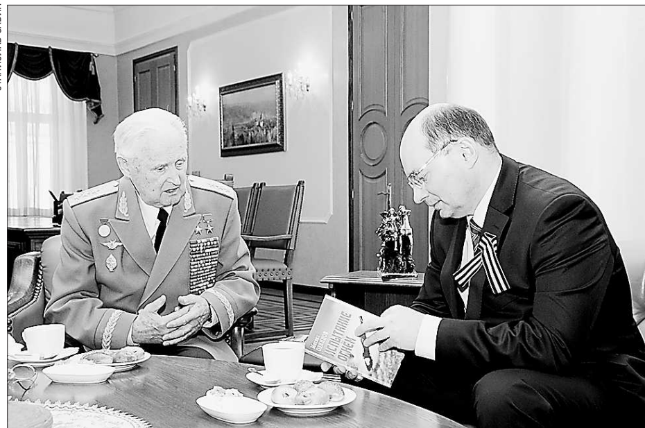
Ветеран войны подарил губернатору Александру Мишарину свою книгу

6 мая на перроне Екатеринбургского вокзала прощальное земляка встречали руководители Свердловского областного и Екатеринбургского городского советов ветеранов генерал-майор в