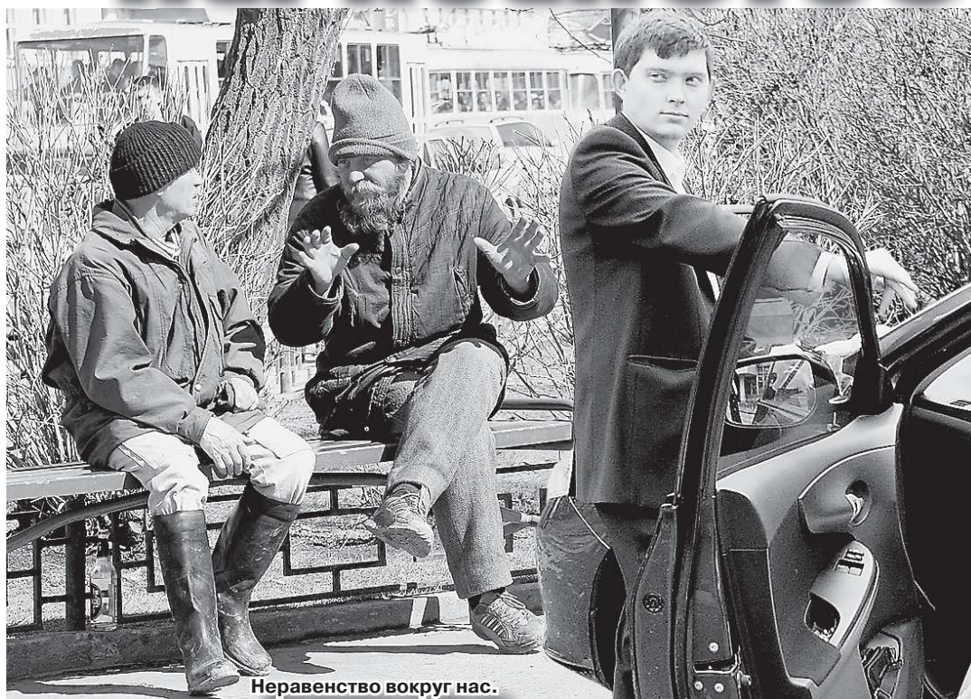
Неравенство вокруг нас.

В те времена зарплата была выше у тех, у кого и сама работа была сложнее и кропотливее. В наши дни наверх могут выбиться не обязательно более умные и образованные люди, но и те, кто заработал