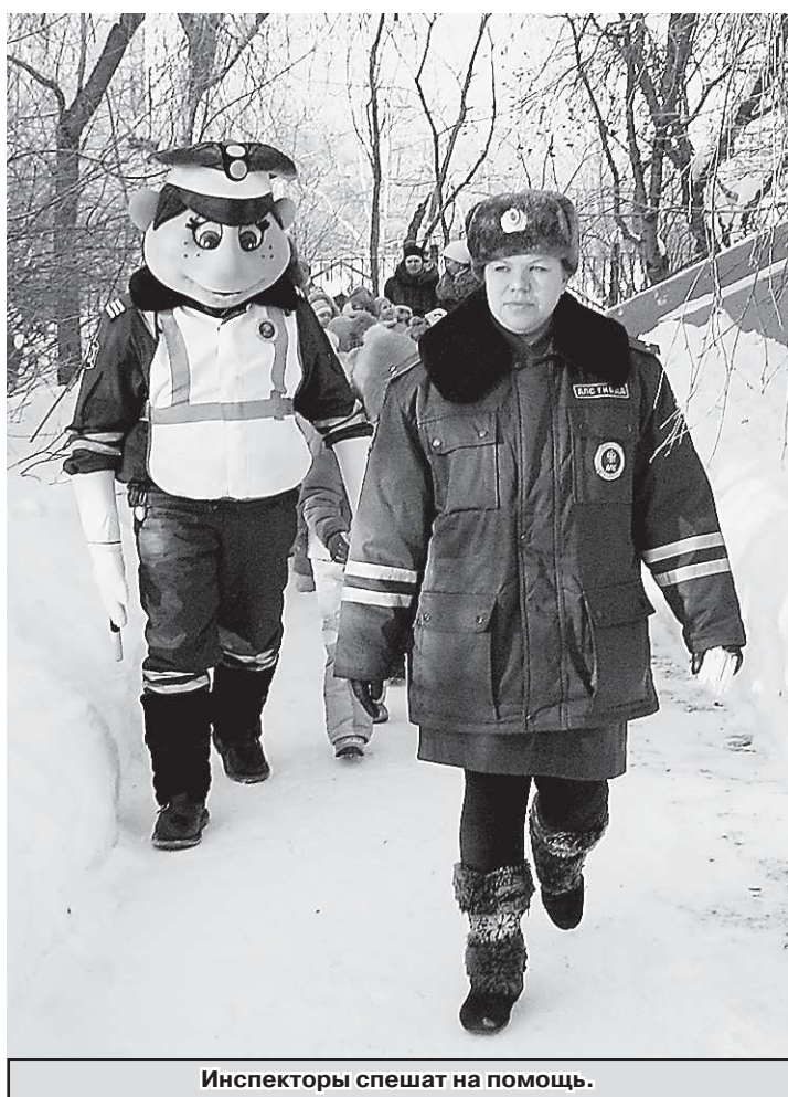
Инспекторы спешат на помощь.