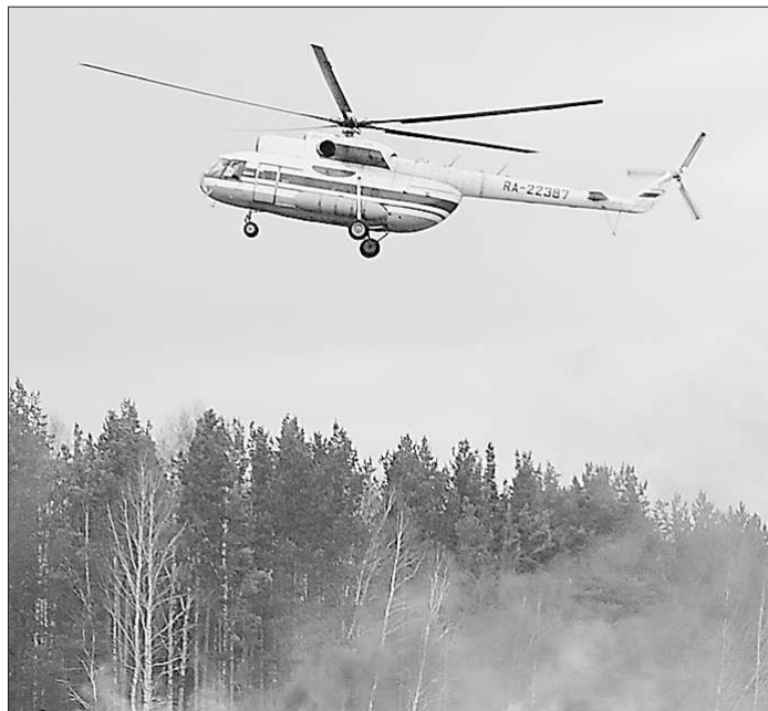
Благодаря авиации эффективность обнаружения лесных пожаров увеличивается многократно.

один из самых эффективных способов обнаружения лесных пожаров. Даже космический мониторинг по целому ряду причин пока не может сравниться с ним. Именно поэтому Уральская база авиационной охраны лесов усилено готовится к новому сезону. На взлётной полосе уже стоят отремонтированные самолёты АН-2 и вертолёты МИ-8. В полной боевой находится и подразделение парашютистов.