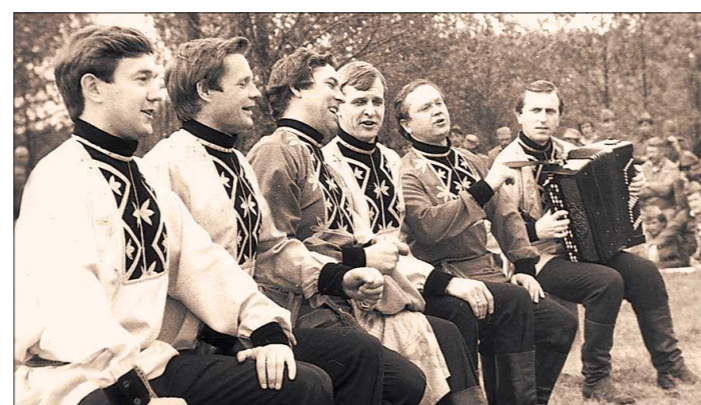
Фотографировать в Чернобыльской зоне было строгаише запрещено. Все снимки уничтожались. Эти – с концерта Уральского хора на лесной опушке – чудом уцелели.

Урал, казалось бы, такой далёкий, тоже оказался причастным к украинско-белорусской беде: сотни наших специалистов разного профиля участвовали в ликвидации последствий взрыва на атомной станции. Ушедшие и живые навсегда объединены словом «ликвидаторы». Для них в Уральском государственном Театре эстрады прошёл концерт «Поющий в Чернобыле»: в сопро-