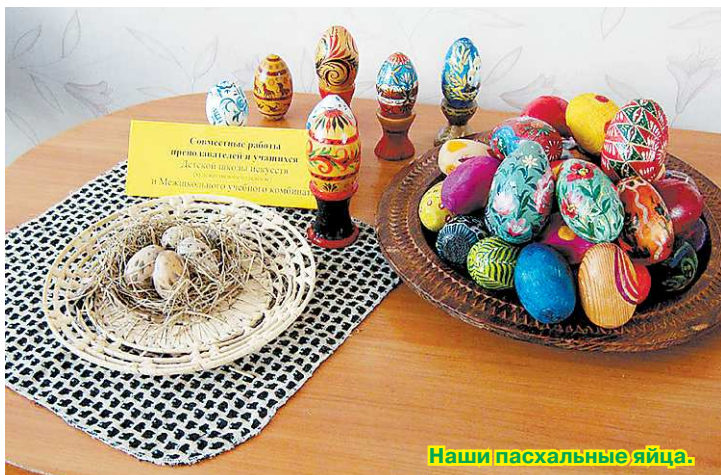
Наши пасхальные яйца.