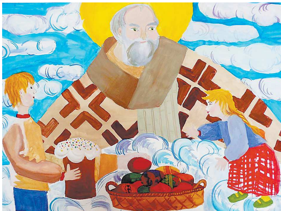
Рисунок Ясения ТУДАКОВА, 13 лет.

Ученики 6-го класса Малышевской детской школы искусств.