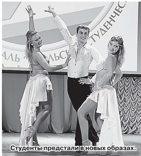
Студенты представили в новых образах.

тив «Точка» из УрАГС. Среди соревнующихся в народном танце лучшими стали ребята из Горного университета – их коллектив «Хамелеон» завоевал первое место. Впечатлил участников фестиваля коллектив «Стрит-джаз» из Магнитогорска. Победителем нынешнего фестиваля он не