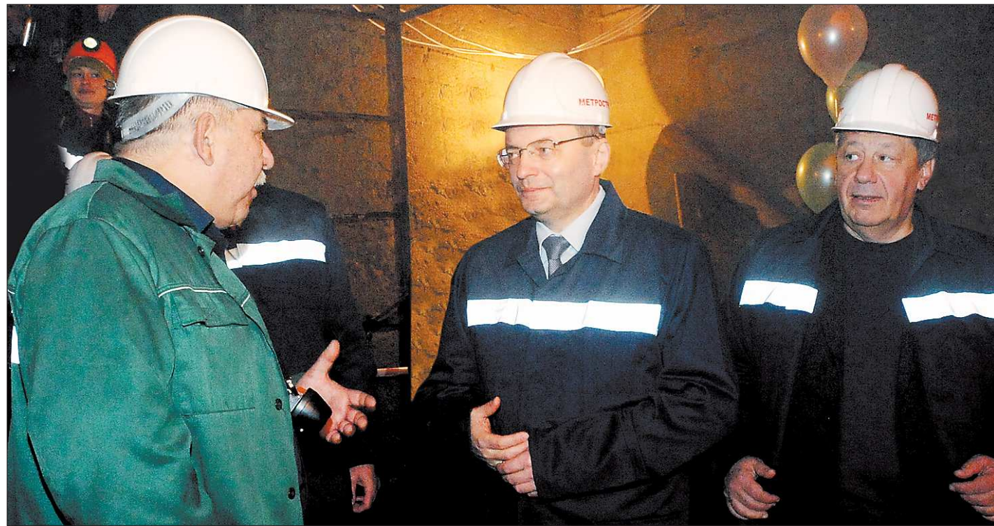
Сбойку ждали все — и власти, и строители.

зачислении в школу перестала иметь значение регистрация по месту жительства. До 20 апреля, официальной даты начала приёма первоклассников, оставалось всего два рабочих дня. Родители начали занимать в школах очереди, составлять списки и графики дежурств. Во всеобщей панике никто не подумал о правомерности неожиданного решения. Скороспелая инициатива муниципального управления образования стала откликом на решение Мосгорсуда о признании недействительной федеральной нормы, по которой при приёме в первый класс дирекция школы может отдать предпочтение одним детям в ущерб другим. Правда, решение ещё не вступило в силу, и столичная мэрия собирает его оспаривать.