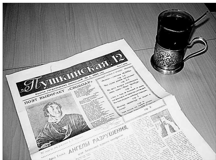
20 лет назад... Сегодня этот экземпляр — реликвия.

известного поэта Владимира Дагурова, творчество которого начиналось на уральской земле.