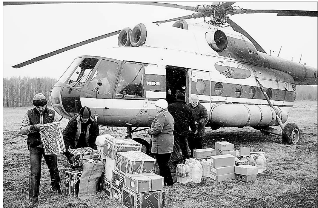
Вертолёт привёз почту и пенсии в Гари.