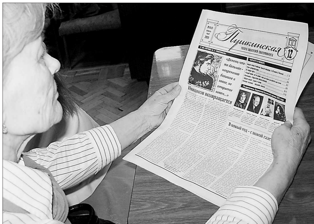
На презентации писательской газеты читатели спрашивали: «А мы чем можем помочь?».