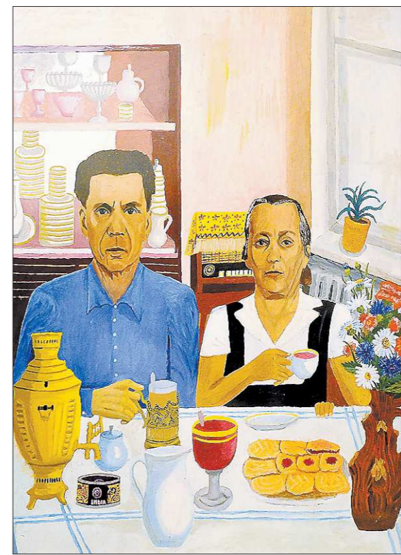
«Автопортрет с женой»

яркие насыщенные краски, подмечает множество интересных деталей из жизни деревни. И художественно осмысленных, представляет свой, радостный, светлый взгляд. Многообразие сюжетов поражает. Кар-