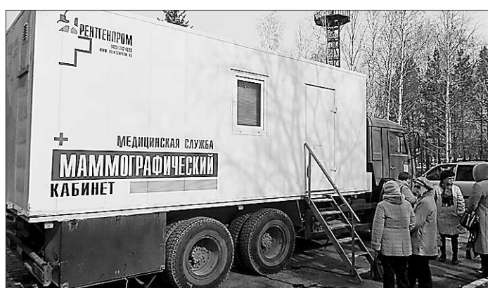
В передвижном маммографе за день обследуют 40-70 пациентов.