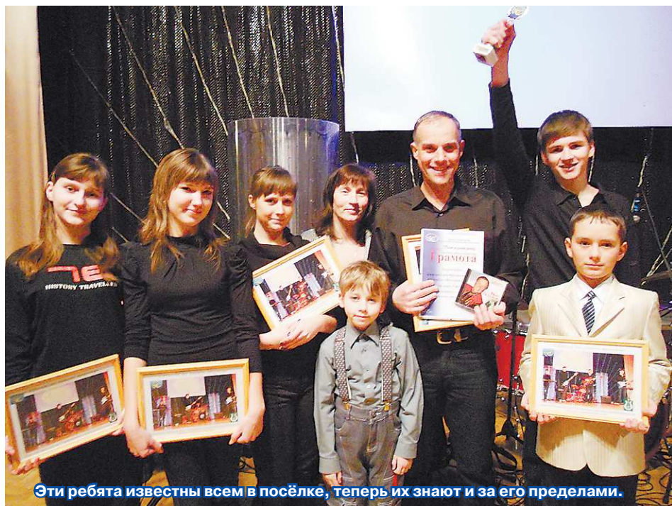
Эти ребята известны всем в посёлке, теперь их знают и за его пределами.

Из репертуара своих песен выбрали «Batman is back» (группа «Несчастный случай»), «Песню без слов» (рок-группа «Кино») и «Траву у дома» (ВИА «Земляне»). Из всех конкурсантов они приехали в Ревду первыми. Разгрузив и подключив аппаратуру, отдохнули. На прослушивании внимательно смотрели, как выступают все участники. Сами вышли на сцену последними, под номером 13 – и «взорвали» зал. Многие аплодировали стоя, снимали выступление «Роджеров» на камеру. Из 13 округов, множества молодых артистов, у каждого из которых было по три песни, жюри выбрало для выступления только 17