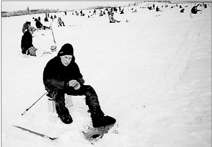
Многие уральцы ходят на рыбалку как на праздник.

Действительно, в законе говорится, что любительское и спортивное рыболовство отныне осуществляется по путёвкам (документам, подтверждающим заключение договора возмездного оказания услуг). Чтобы его получить, рыболов должен предъявить паспорт или иной документ, удостоверяющий личность. По договору исполнитель обязуется по заданию заказчика совершить определённые действия, а заказчик — их оплатить.