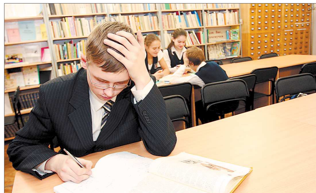
Есть о чём подумать юному дарованию.

Ставка делается на одарённых ребят, которых будут искать и поддерживать. Конечно, и прежде в Свердловской области существовали разнообразные олимпиады, конкурсы и премии, летние и зимние школы, специальные курсы и программы обучения. Один только екатеринбургский центр «Одарённость и технологии» осуществил уже семь выпусков школьников. Эти и подобные мероприятия помогают талантам поверить в свои си-