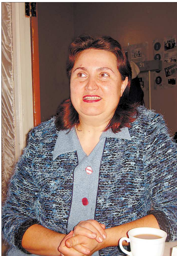
Все репетиции начинаются вечером.