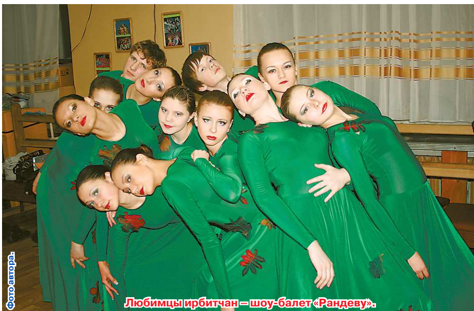
Любимцы ирбитчан – шоу-балет «Рандеву».