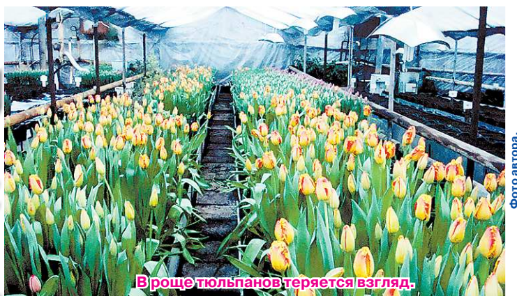
В роще тюльпанов теряется взгляд.