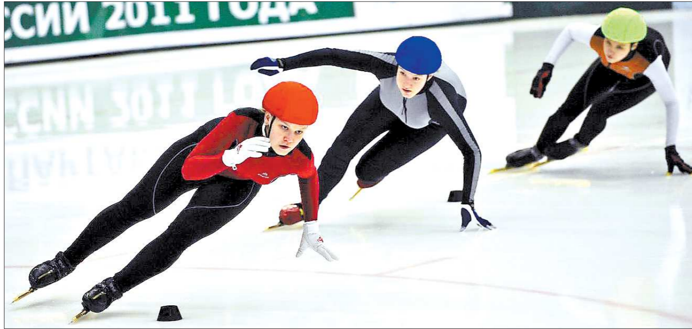
Момент состязаний по шорт-треку в Новоуральске.

Большую часть Спартакиады наши занимали четвёртое место, но в последний момент пропустили вперед команду Санкт-Петербурга. Любопытно при этом, что в неофициальном, так называемом «медальном» зачёте, наши уступили только моск-